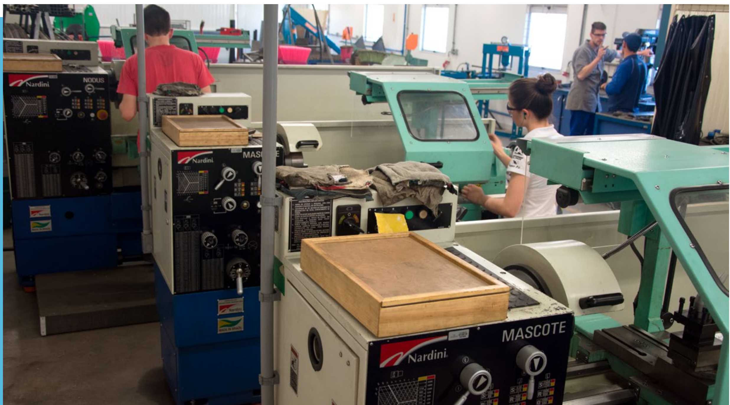
Laboratório de Processos de Fabricação