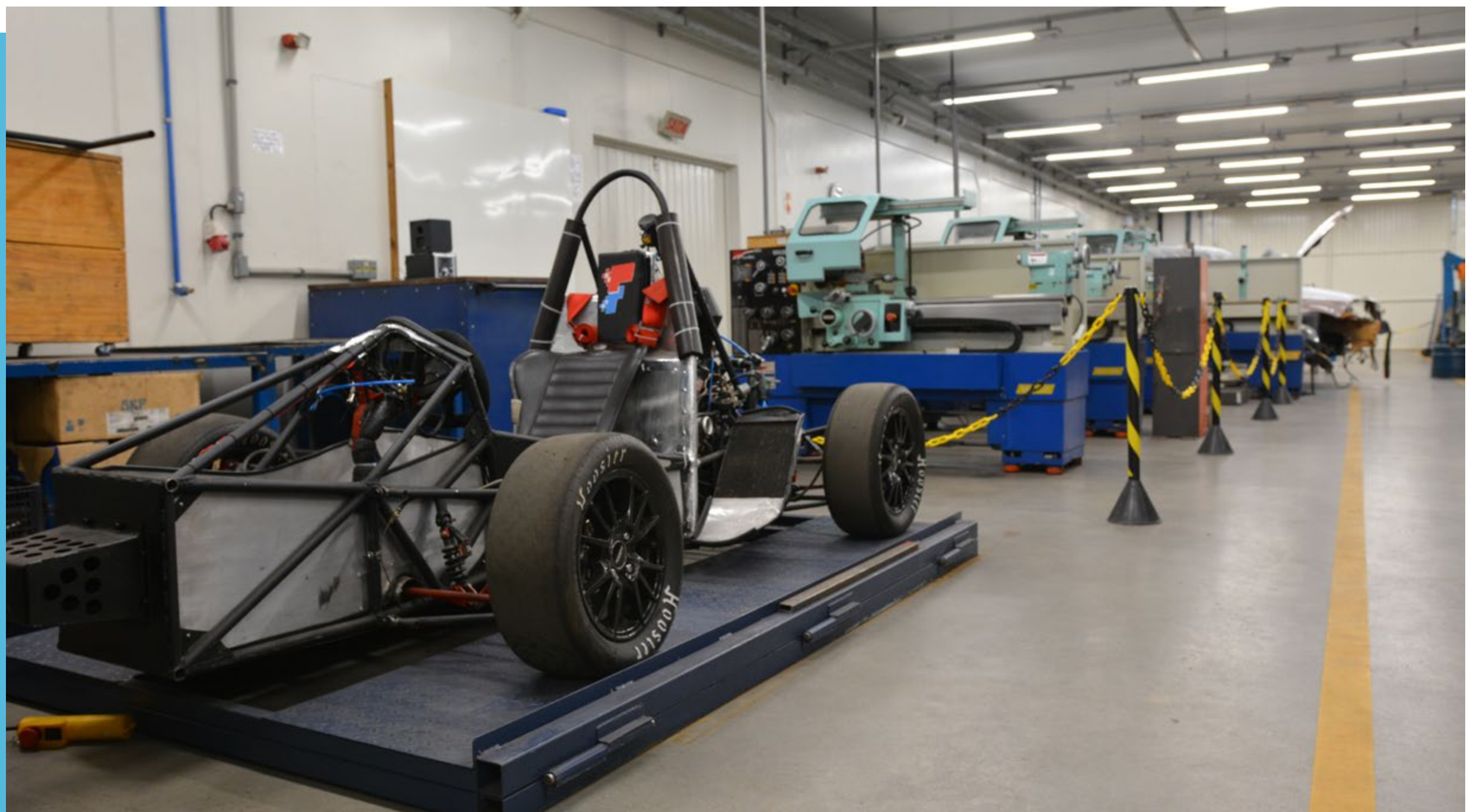
Laboratório de Processos de Fabricação

“Na graduação tive acesso a softwares e programas de engenharia os quais utilizo atualmente na minha profissão. A graduação nos ensina a nos desafiar, e o mercado de trabalho nos mostra que sempre devemos estar evoluindo didaticamente. A graduação nos proporciona uma base de conhecimento muito importante para desempenharmos nosso papel no mercado de trabalho”.