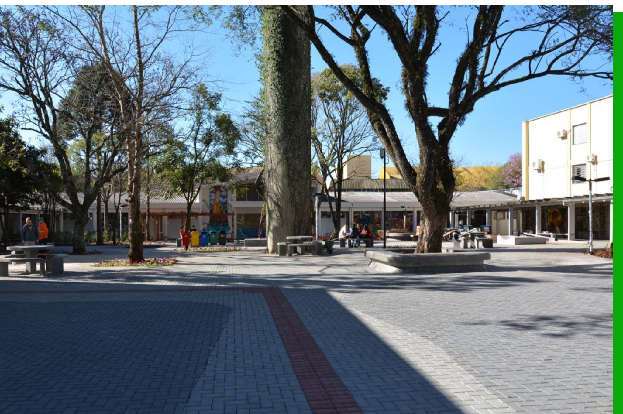
Jardim das Artes

O curso conta com os melhores professores da região, a grande maioria deles mestres ou doutores. Ou seja, os professores que vão dar aula para você na graduação todos os dias, têm competência de sobra para dar aulas em Pós-graduações, Mestrados ou até mesmo em Doutorados. E isso com certeza, vai fazer toda a diferença na sua formação profissional!