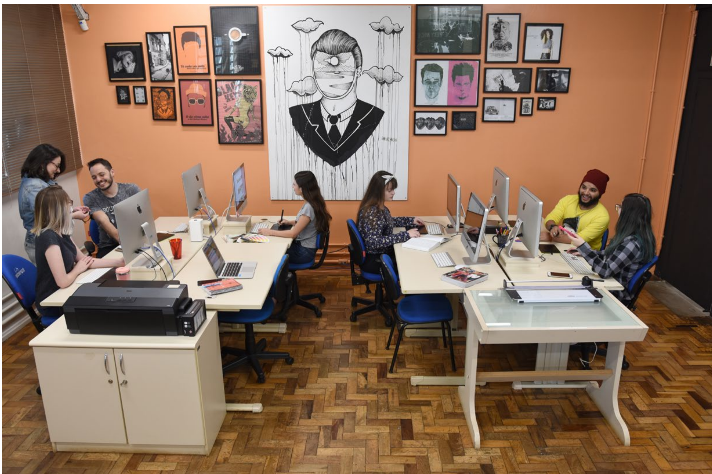
Agência Experimental - ACIN

As visitas a agências de Chapecó e outras cidades, viagens a festivais e congressos da área, e inúmeras outras experiências que você vai viver durante sua graduação, são outros diferenciais que vão fazer o curso valer muito a pena!