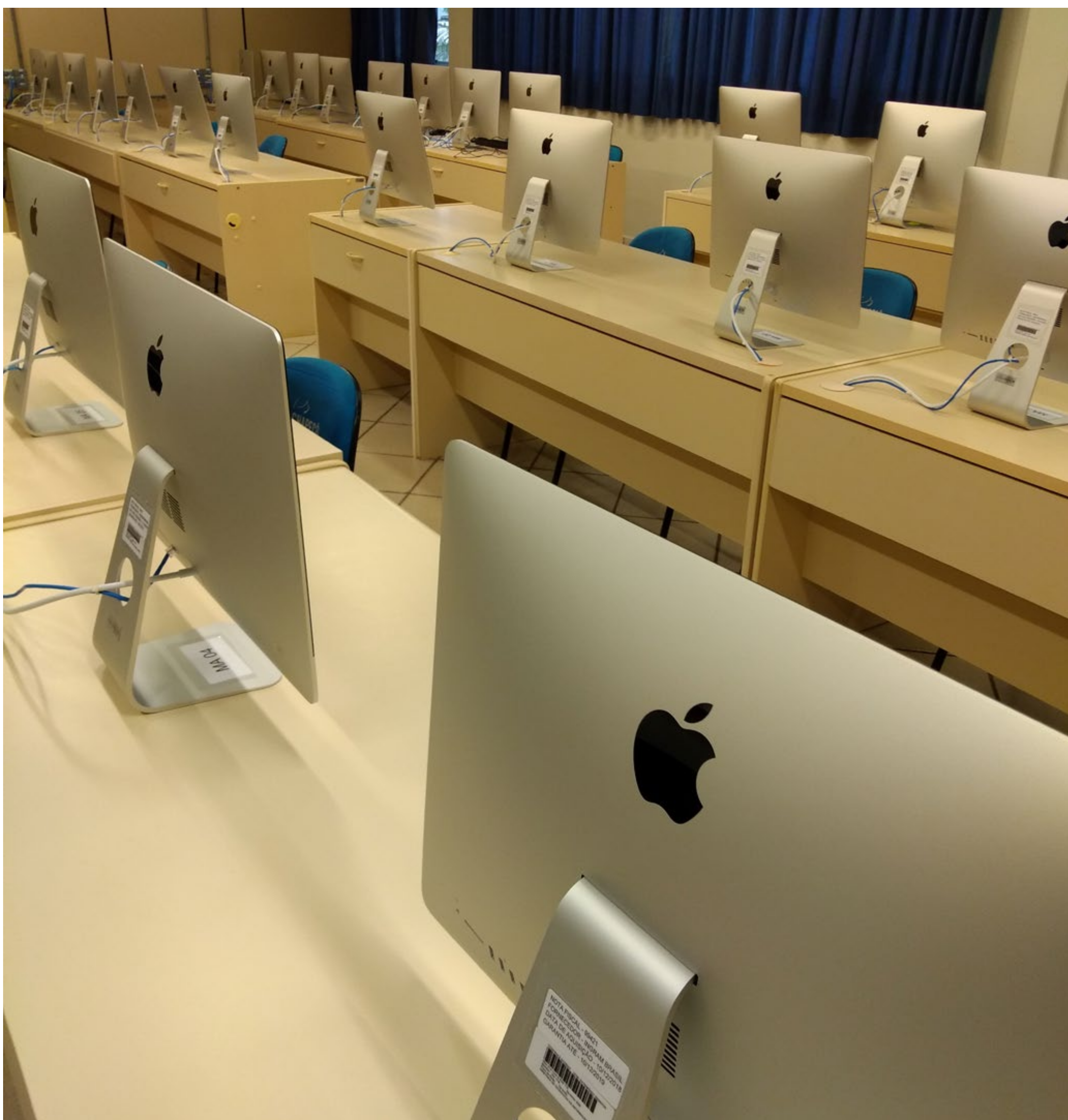
Laboratório de Criação Gráfica com iMacs individuais