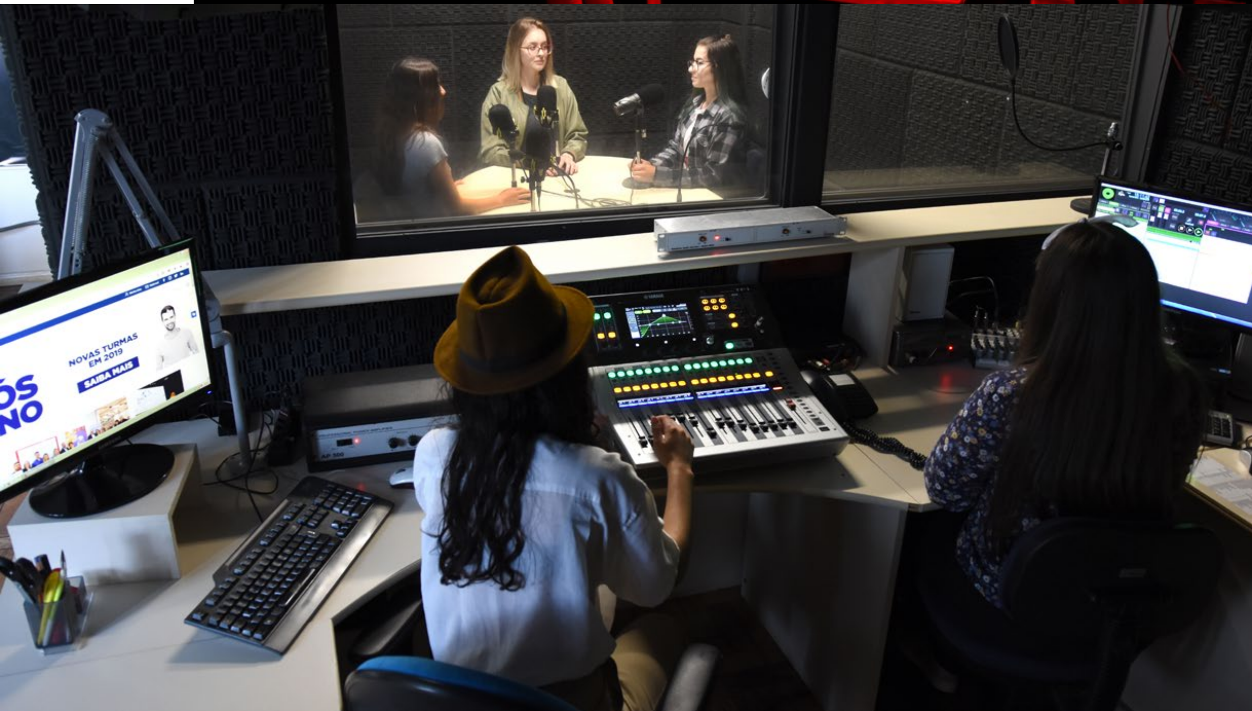
Laboratório de Rádio